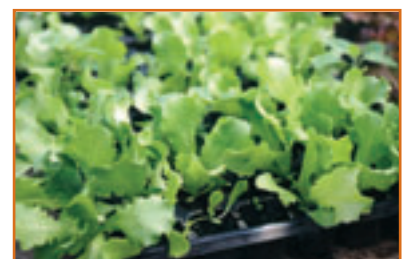
Gut gewachsen: Bio-Setzlinge gedeihen ohne Chemie.

Adressen von Gärtnereien , die in Deutschland Bio-Jungpflanzen von Gemüse und Blumen anbieten, kann man jetzt im Internet abrufen. Demeter Baden-Württemberg nennt dort Betriebe, die Setzlinge in Bio-Qualität verkaufen. Die Jungpflanzen sind ohne chemisch-synthetische Pflanzenschutz- und Düngemittel in wertvollen Bio-Komposterden gewachsen. »Sie passen sich dem biologischen Anbau besser an als konventionelle Jungpflanzen und sind robuster«, erklärt Demeter. www.demeter.de/bw