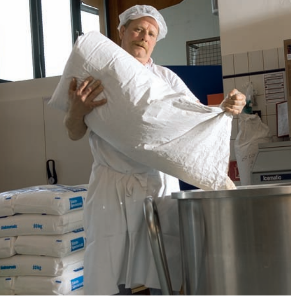
MIT KRAFT | In wenigen Minuten verarbeiten die Metallarme der Rührmaschine die Zutaten zu rund 100 Kilogramm Teig.