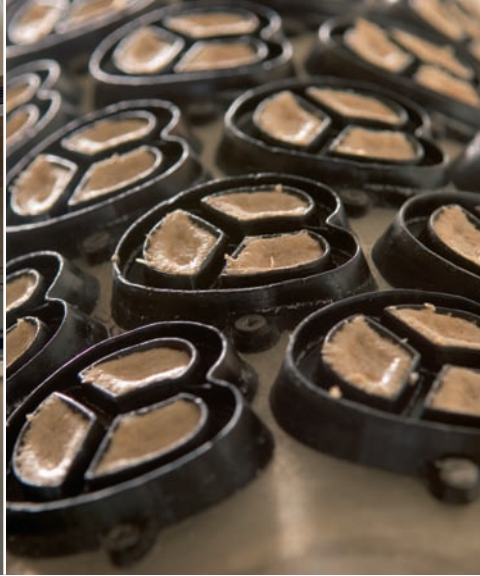
MIT SYSTEM | Durch die maschinelle Formung über Walzen wurde eine massenhafte Herstellung der Brezeln möglich.